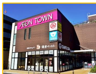
【 新船橋店 】