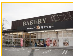
【 稲毛長沼店 】