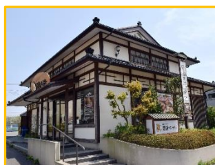
【 新鎌ヶ谷店 】