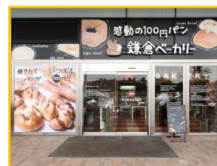
【 ユニモちはら台店 】